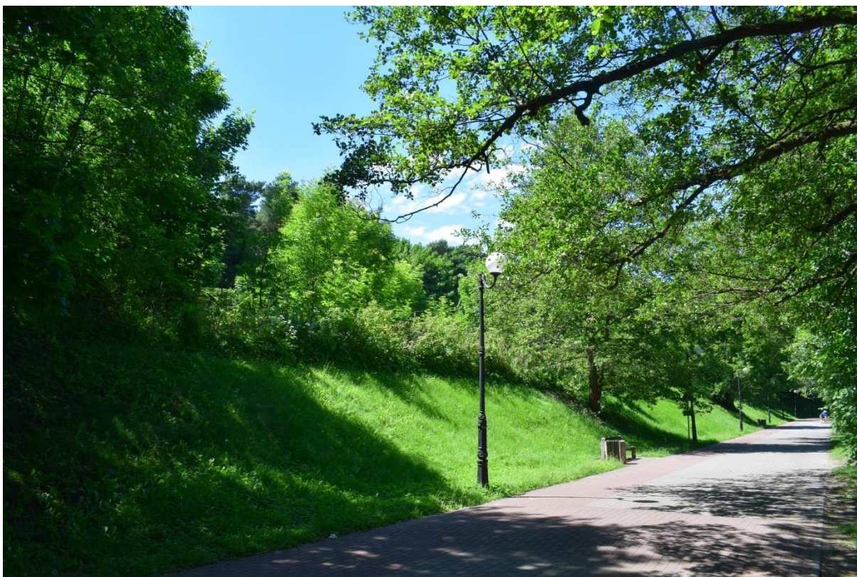
Teren między ul. Grunwaldzką i ul. Nadbrzeżną

odbywa się wzmożony ruch pieszych, rowerzystów oraz samochodów. Szerokość ciągu wzdłuż przedmiotowego terenu wynosi jedynie ok. 7-7,5m. W czasie wakacyjnym, kiedy większa liczba osób korzysta z promenady oraz zwiększa się ruch samochodów dojeżdżających do Mrągowskiego Ośrodka Sportowego BAZA, przepustowość ciągu jest bardzo mocno ograniczona. Mając na uwadze fakt, że zapisy projektu planu przewidują dopuszczenie zabudowy o wysokości 4 kondygnacji od strony Jeziora Czos, zasadnym jest zachowanie nieprzekraczalnych linii zabudowy zgodnie z projektami MPZP przyjętymi Uchwałami nr III/7/2014 z dnia 22 grudnia 2014r. oraz XLI/1/2018 z 28 lutego 2018r. Rady Miejskiej w Mrągowie. Lokalizacja budynku zbyt blisko najwęższego odcinka ścieżki spowoduje powstanie „wąskiego gardła” i, z uwagi na fakt bliskości nabrzeża jeziora, istnieje niebezpieczeństwo wypadków wśród użytkowników promenady. Wprowadzenie dużego kubaturowo obiektu w zbyt bliskiej odległości od ciągu pieszego i jeziora spowoduje negatywne odbieranie tej przestrzeni. Jakakolwiek zabudowa planowana w tym miejscu powinna wpisać się w istniejące otoczenie tak, by nie stworzyć architektonicznej dominanty .